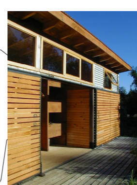
CASA CUDICO, IX REGIÓN ,CHILE.