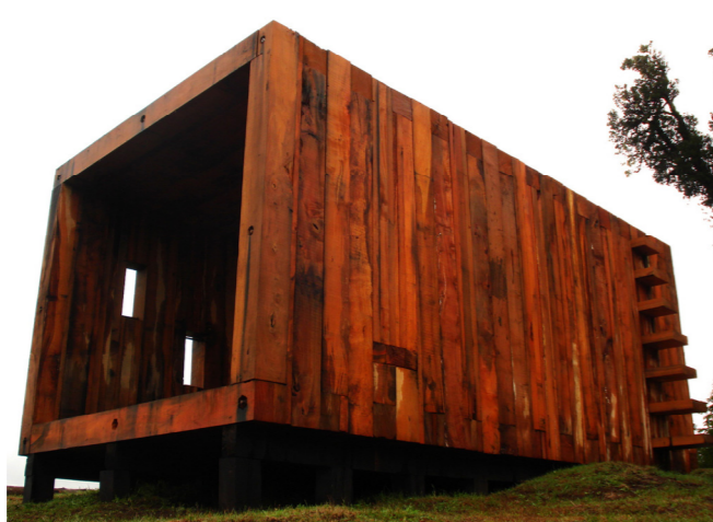
CASETÓN DE ACOPIO PINOHACHO, X REGIÓN, CHILE.