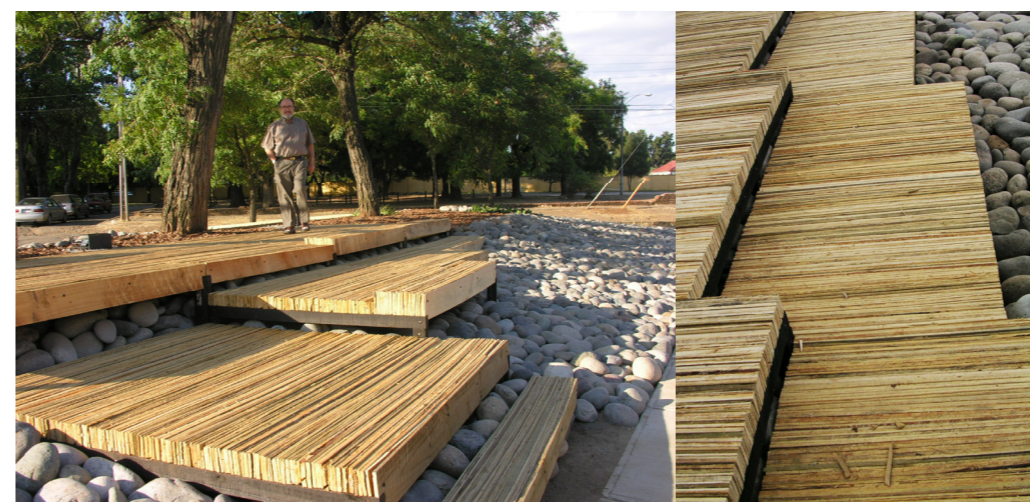
PLAZA NACIONAL TALCA, VII REGIÓN ,CHILE.