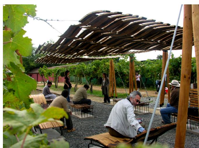
PLAZA DESCANSO TALCA, VIÑA CASA DONOSO VII REGIÓN ,CHILE.